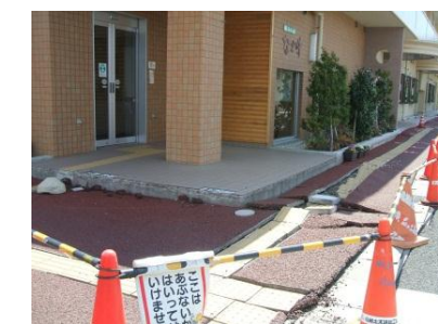
亀裂が入った「なご味」前歩道