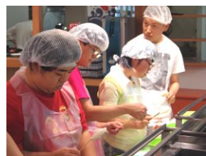
笹かま作り体験中。カラオケ&屋食♪