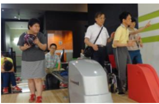
遊興三昧① ポーリング