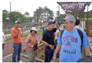
八木山動物園を散策。わらしべ舎でカレー。