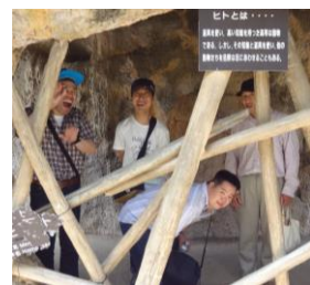
動物園にいきました。