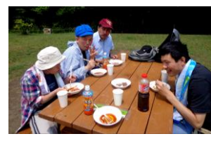
水の森公園でバーベキュー～。うまか～♪