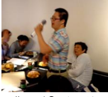
遊興三昧② カラオケ