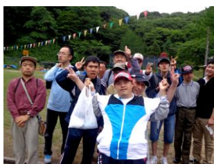
秋保でバーベキュー～