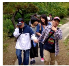
秋保森林公園で森林浴♪足湯でリラックス♪